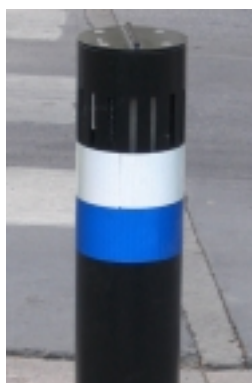
Riktningsgivare på topplocket.