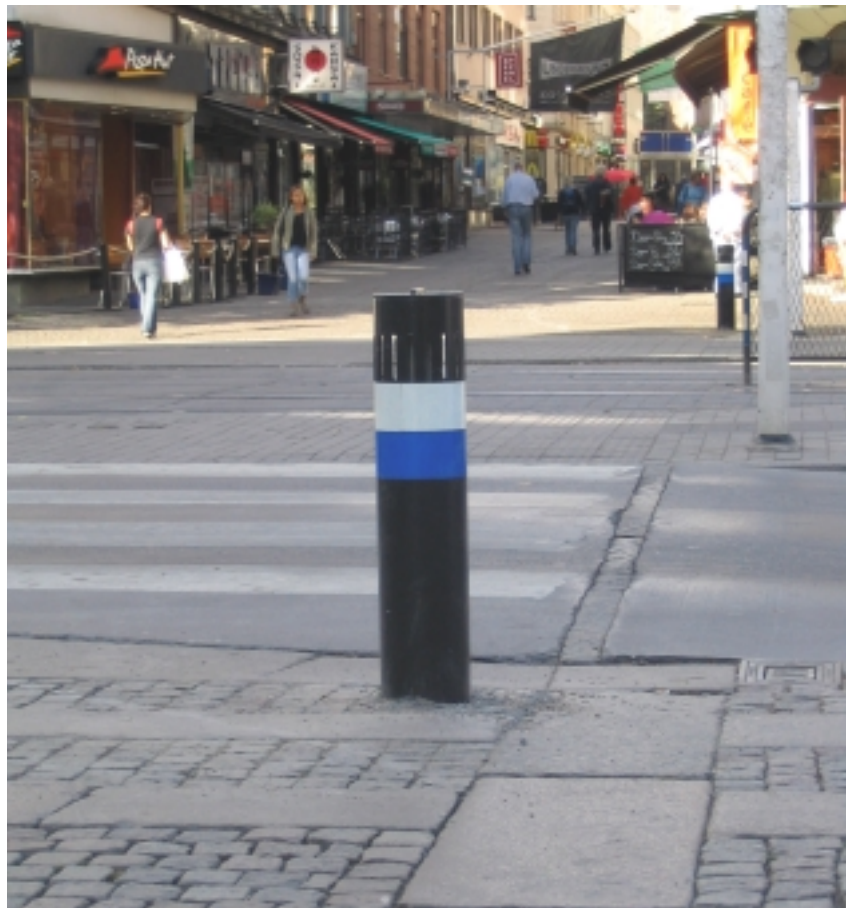
Pollare KNM Piteå. Här med ljudenhet som avger ett tickande ljud. Ljudnivån på tickandet är mellan 60-83 decibel. Nivån styrs automatiskt av bullernivån kring pollaren.